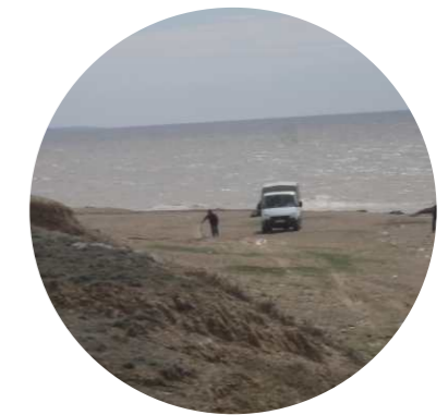
Қара-өткіл ауылы / Kara-otkil town