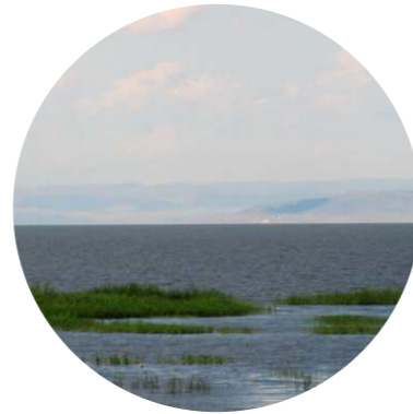
Құйған ауылы / Kuigan town