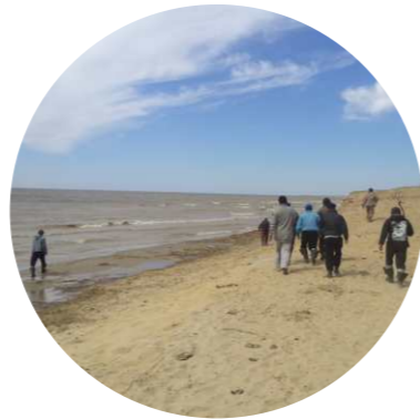
Аманат ауылы / Amanat town

KZ № 6 учаске – ШҚО, Күршім ауданы, Зайсан көлі – оң жақ жағалау учаскесі, Бархот мүйісінен ағыс бойынша төмен Қарағанды мүйісіне дейін, 15 шақырым тереңдікке. Ұзындығы – 26 ш., аумағы – 39 000 га.