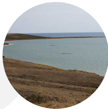
Жолнұсқау ауылы / Zholnuskau town

KZ № 1 учаске – ШҚО, Тарбағатай ауданы, Зайсан көлі – сол жақ жағалау, Қамыс зауытынан ағыс бойынша төмен айлаққа дейін, 15 шақырым тереңдікке. Ұзындығы – 27 ш., аумағы 40 500 га.